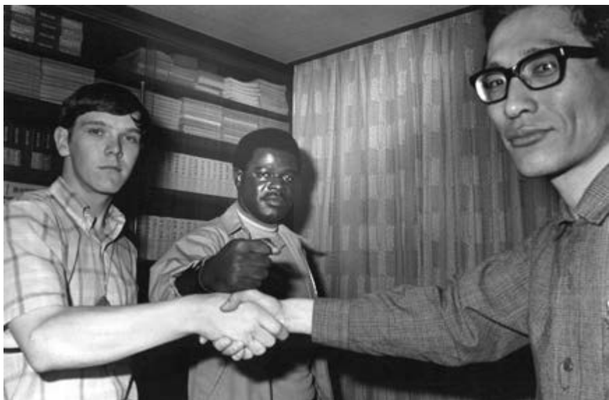
С антивоенно настроенными американскими солдатами, 15 октября 1969 г.