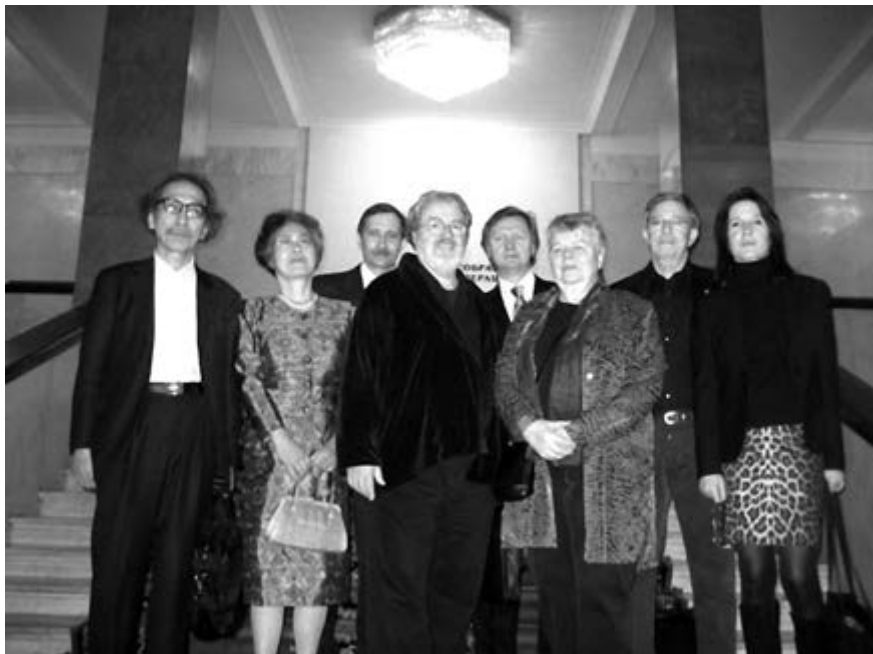
Члены Международного Совета АИРО Карл Аймермахер, Харуки Вада, Стивен Козн и их супруги были приняты в Государственной Думе РФ. Москва, 18 марта 2008 г.