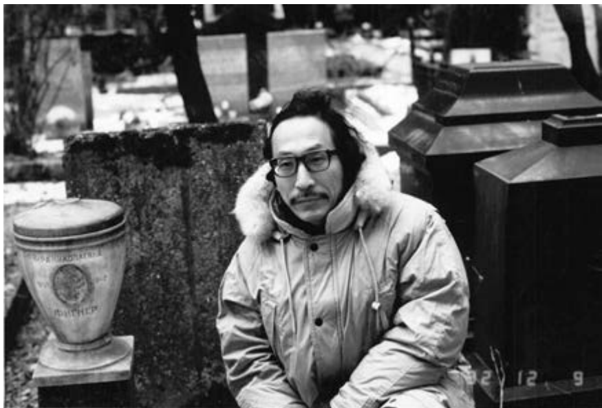
У могилы Веры Фигнер (во время международной научной конференции, посвященной 150-летию со дня рождения П. А. Кропоткина), декабрь 1992 г.