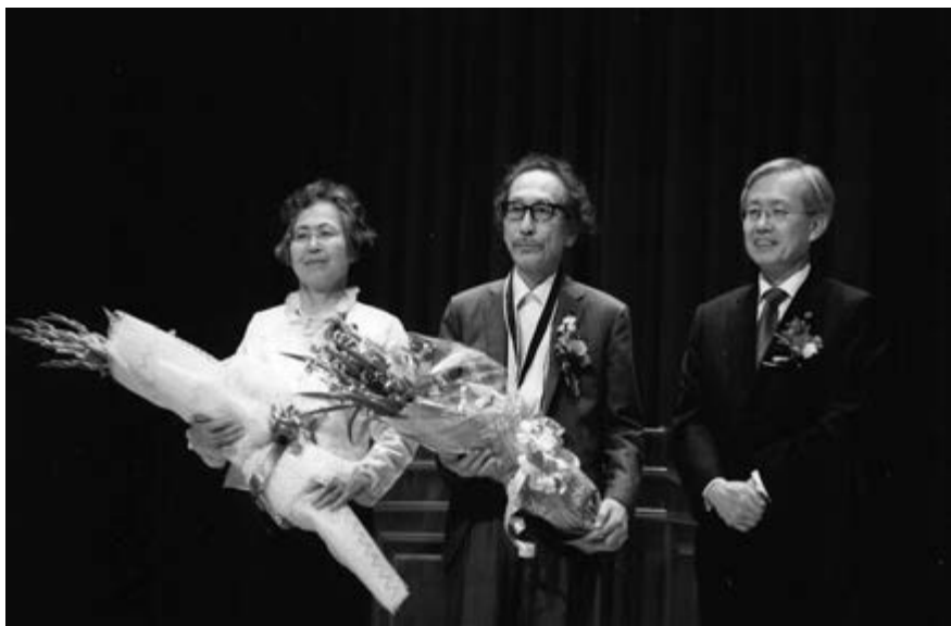
Получение премии имени Кима Дае Джуня в Чосонском университете, 12 августа 2010 г. С женой и ректором университета