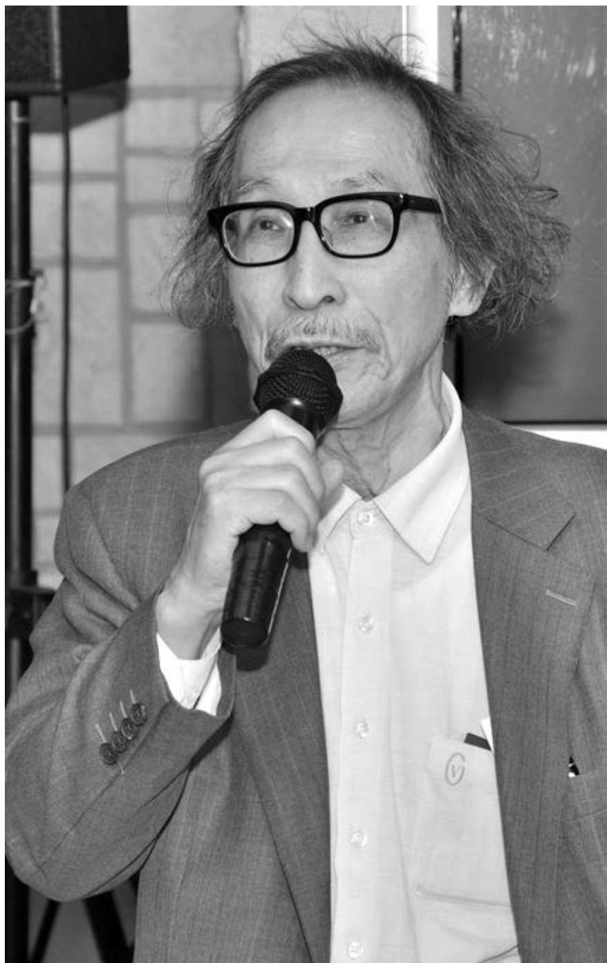
На 20-летији АИРО, 2008 г.