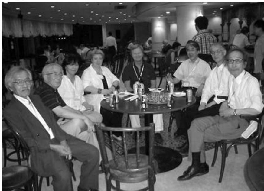
Чествование по случаю 77-летия во время IX Мирового конгресса ICEES в Макухари (Токио), август 2015 г.