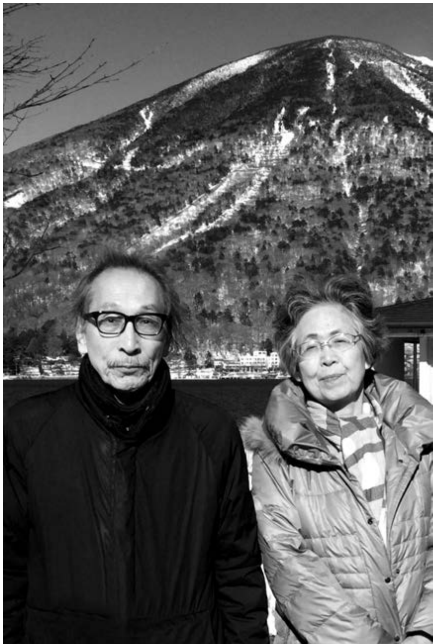
С женой. 1 января 2018 г., Никко