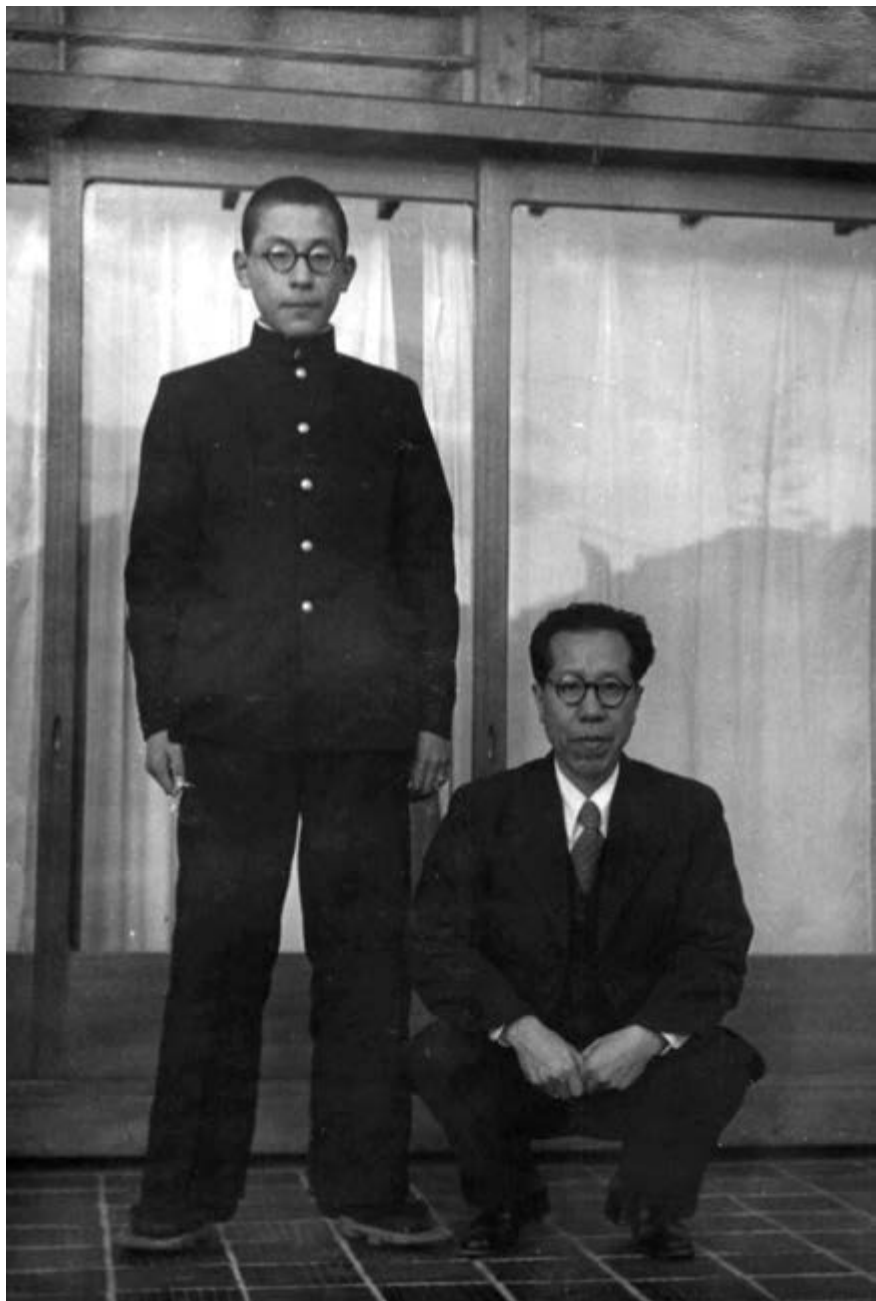
С отцом, ученик высшей средней школы, январь 1954 г.