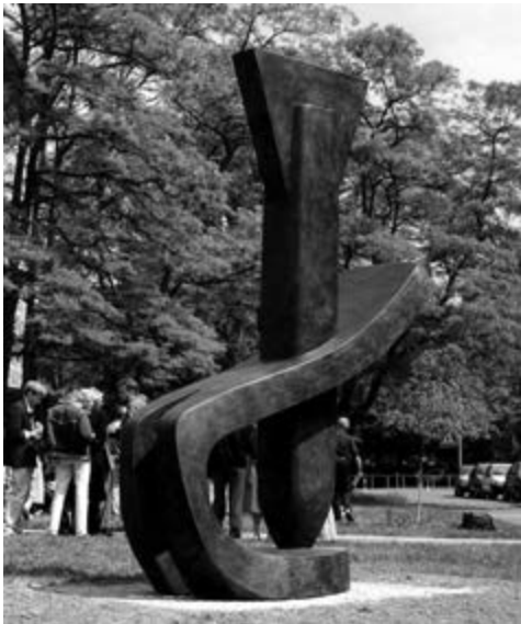
Памятник погибшим от бомб. Вюрцбург.