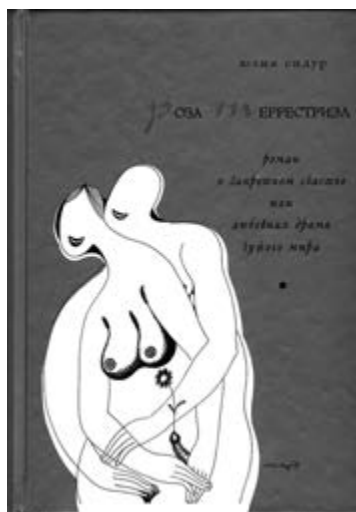
Юлия Сидур. «Роза Террестриэл». М., 2003