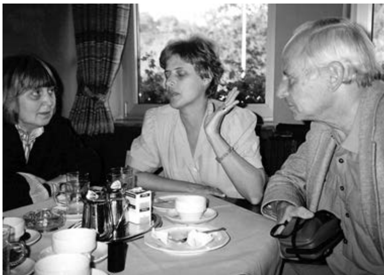
Юлия, Петра Келли, Герт Бастиан под Бонном, 1989.