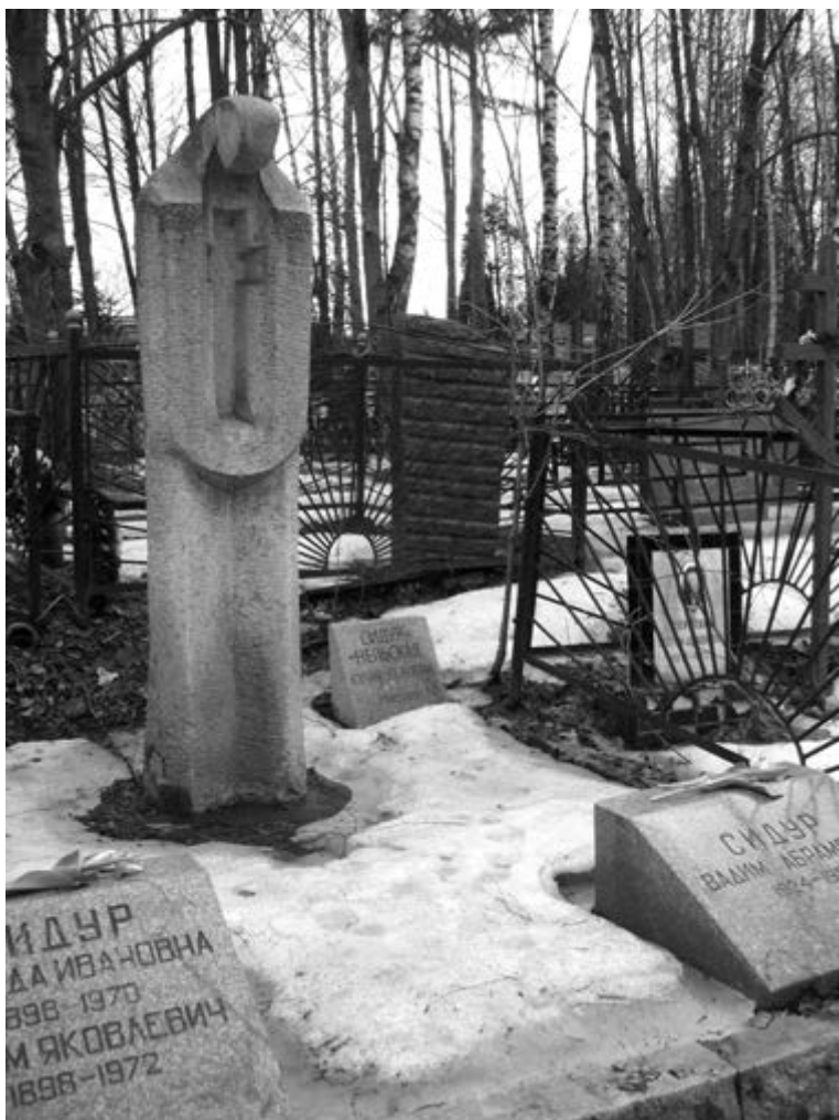
Семейная могила в Переделкино.