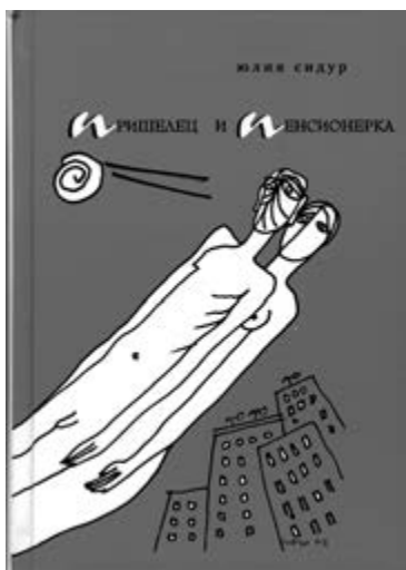
Юлия Сидур. «Пришелец и пенсионерка». М., 2005