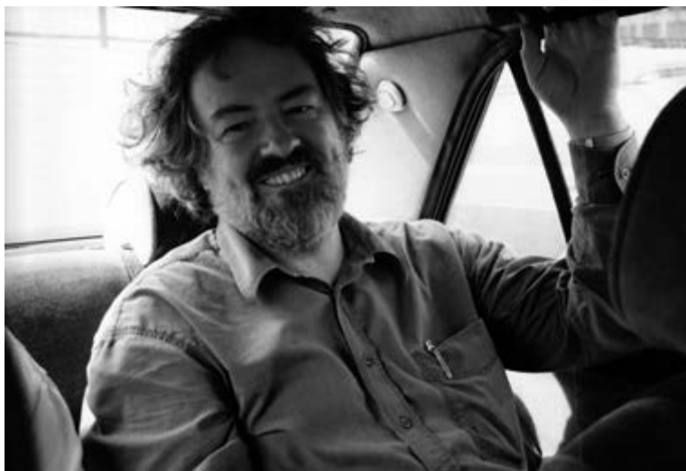
Карл Аймермахер в Москве, 1998.