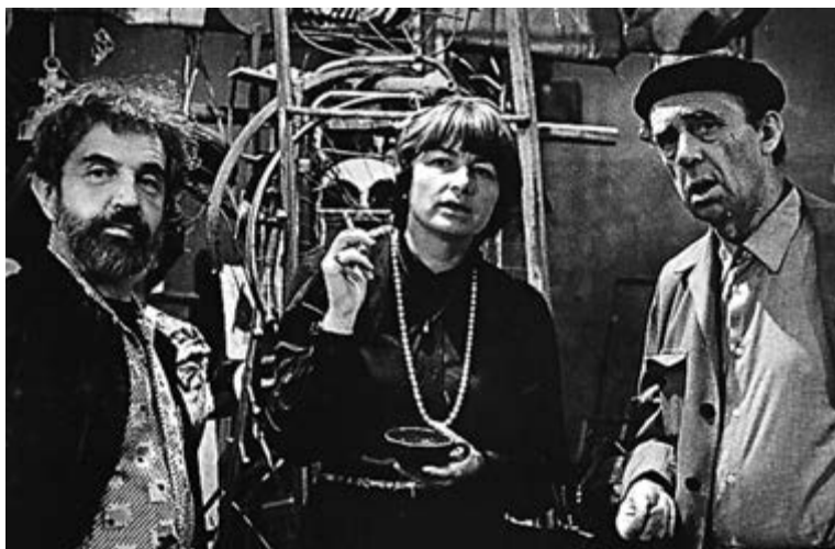
Вадим Сидур, Дорис Шенк, Генрих Белль, 1979.