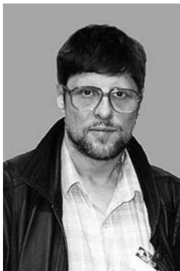
Михаил Сидур, 80-е годы.