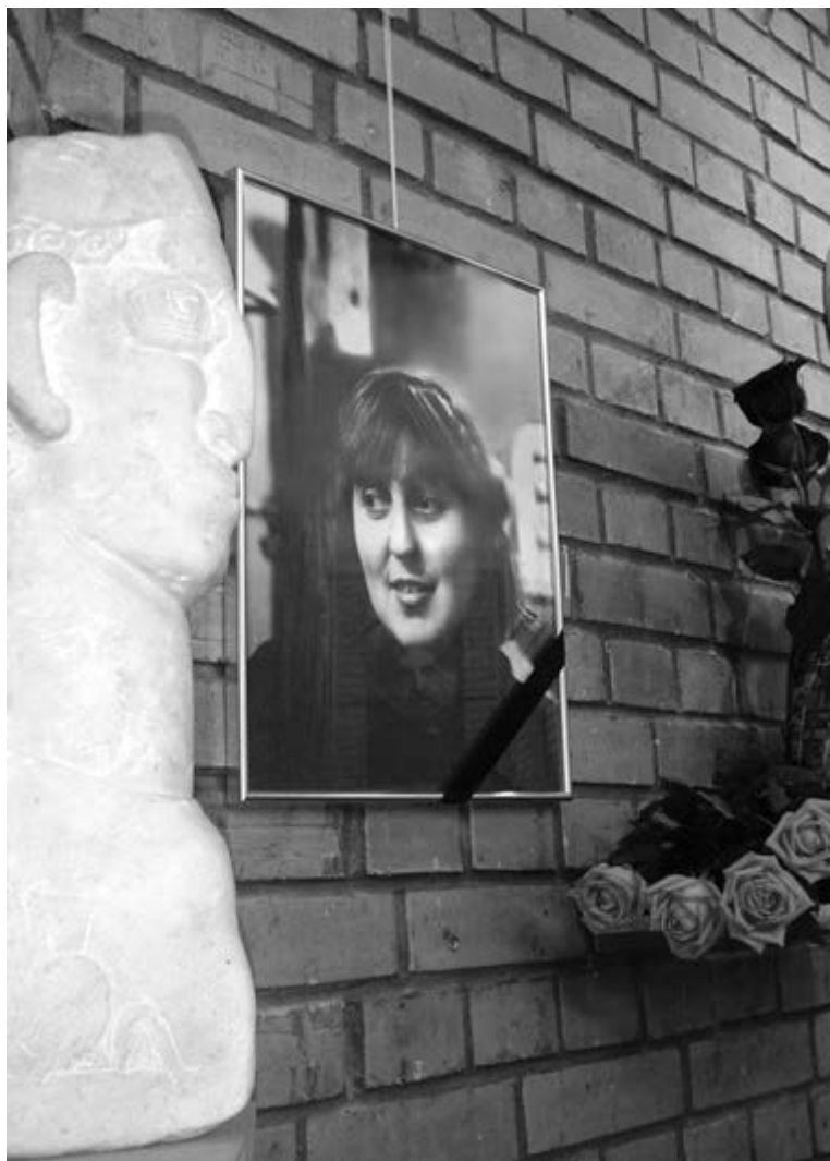
Прощание с Юлией Сидур, 2006.