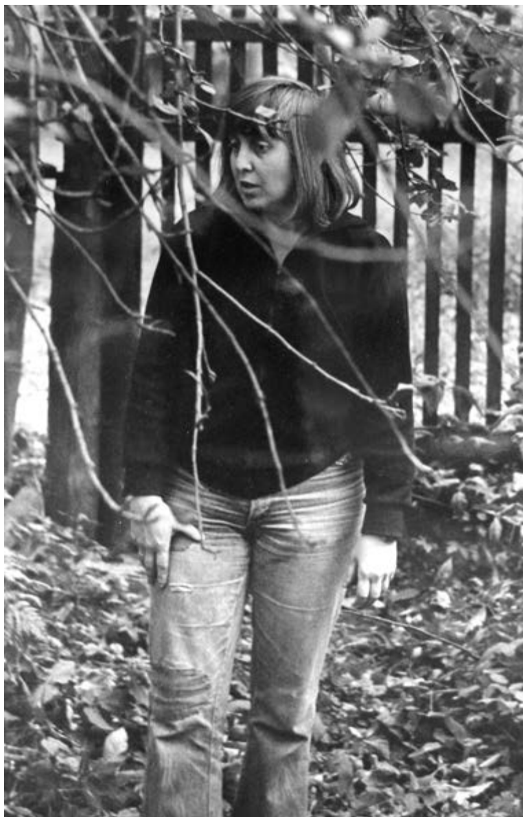
Алабино, 1978.