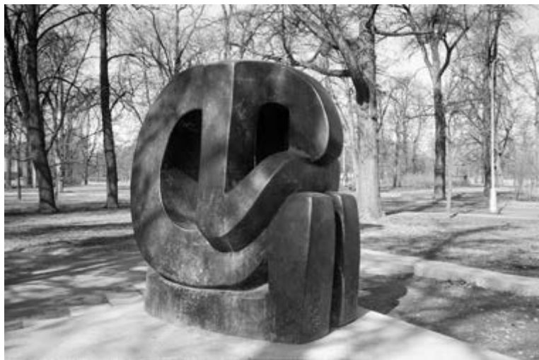
Памятник жертвам Холокоста (Формула скорби). г. Пушкин.