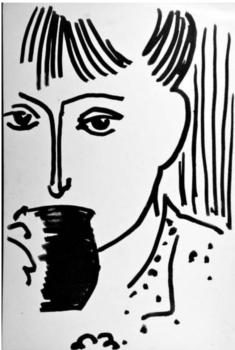
Юлия. Рисунок Вадима Сидура. Вторая половина 1950-х годов