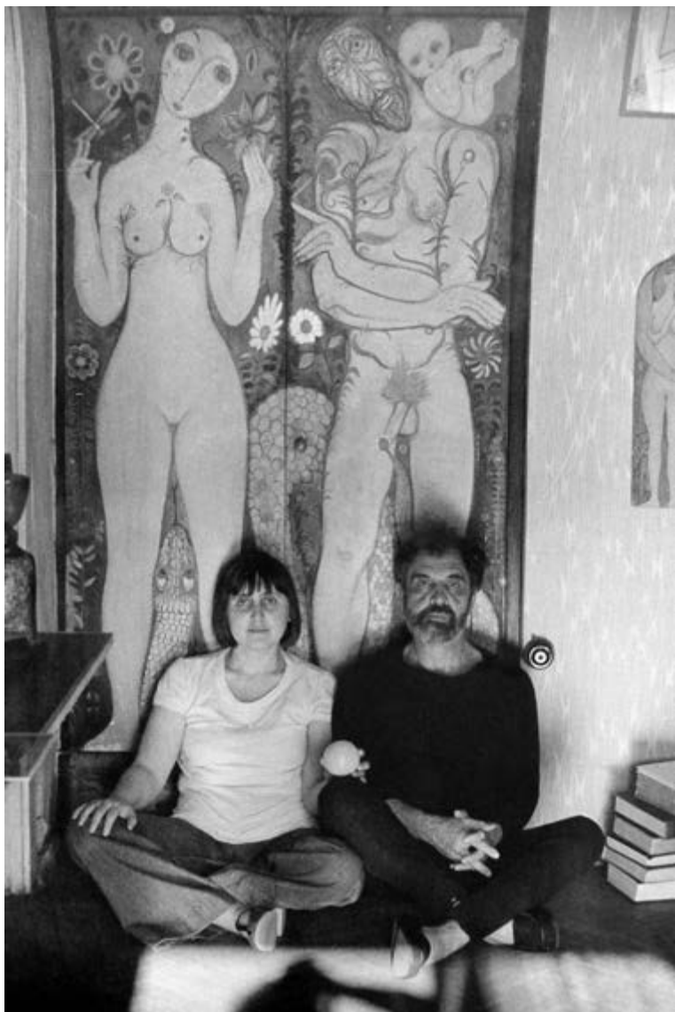
Адам и Ева, 1976.