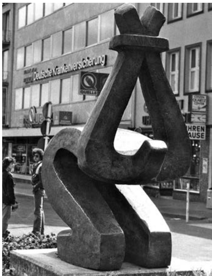
Памятник погибшим от насилия. Кассель.