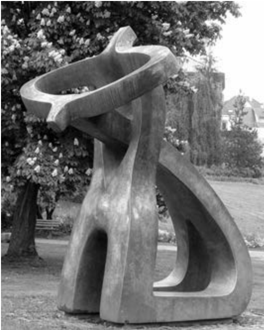
Памятник погибшим от любви. Оффенбург.