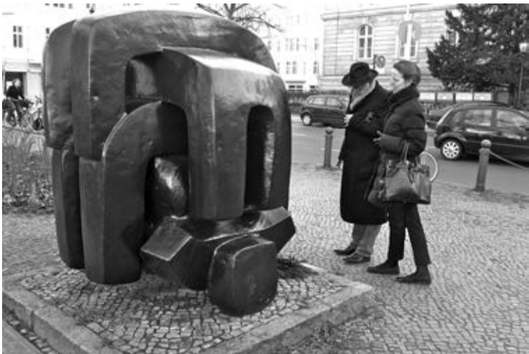
Треблинка. Берлин.