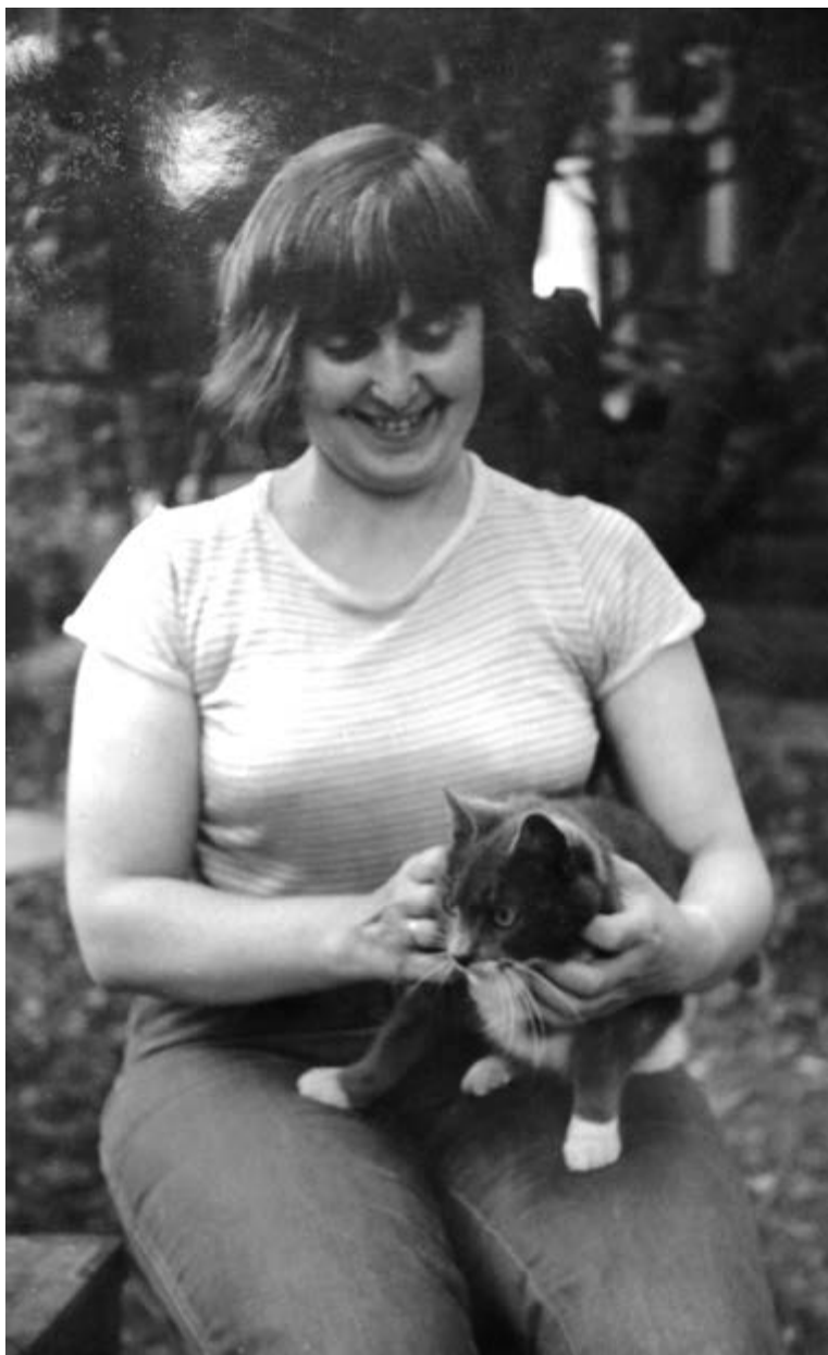
Алабино, 1978.