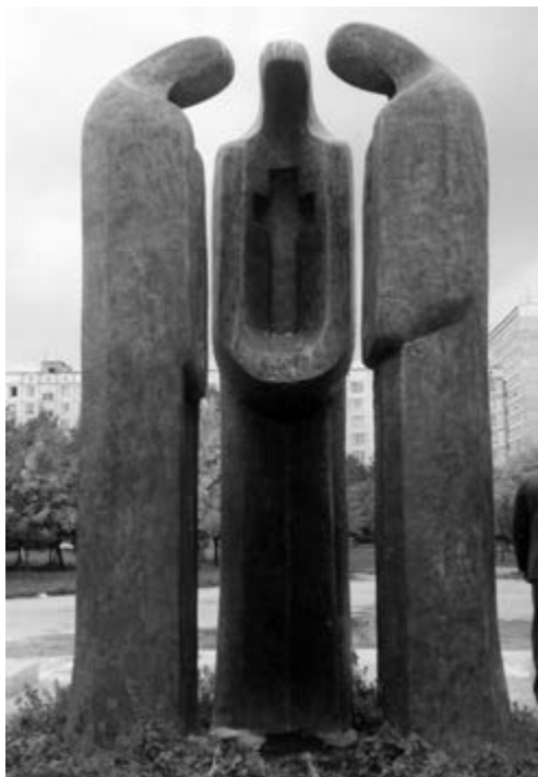
Памятник воинам-афганцам (Памятник оставшимся без погребения). Москва.